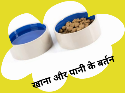
खाना और पानी के बर्तन