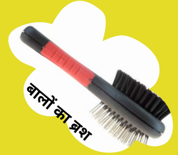
बालों का ब्रश