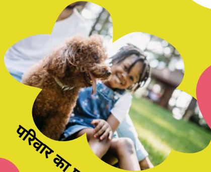
परिवार का प्यार