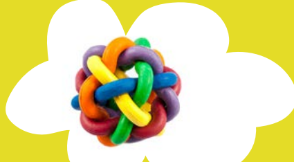
चबाने के लिए खिलौने