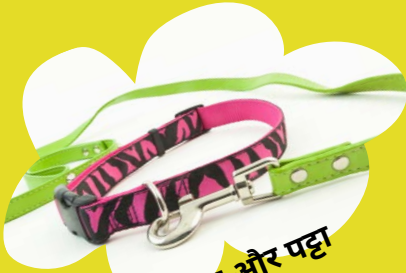
कॉलर और पट्टा