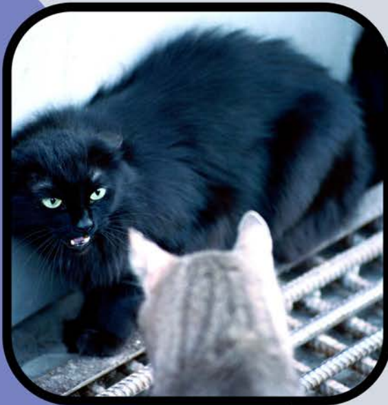
Defendiendo su espacio