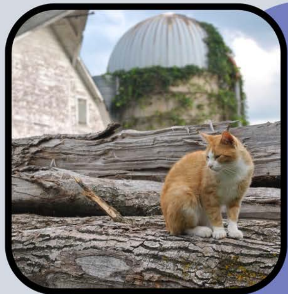
Protegiendo sus hogares