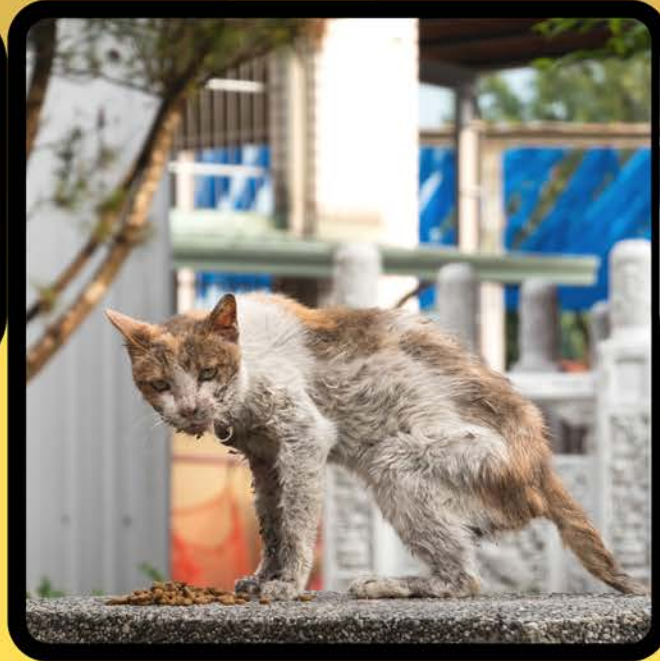
Un gato callejero pudo haber vivido en interiores en el pasado