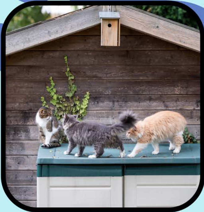
Observar la colonia de gatos y programar citas