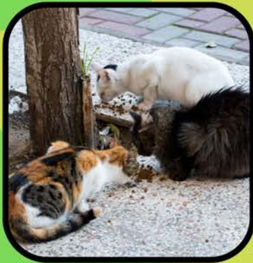
Comida y agua