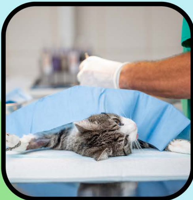
Alojamiento durante la noche y transporte a la clínica para esterilización o castración