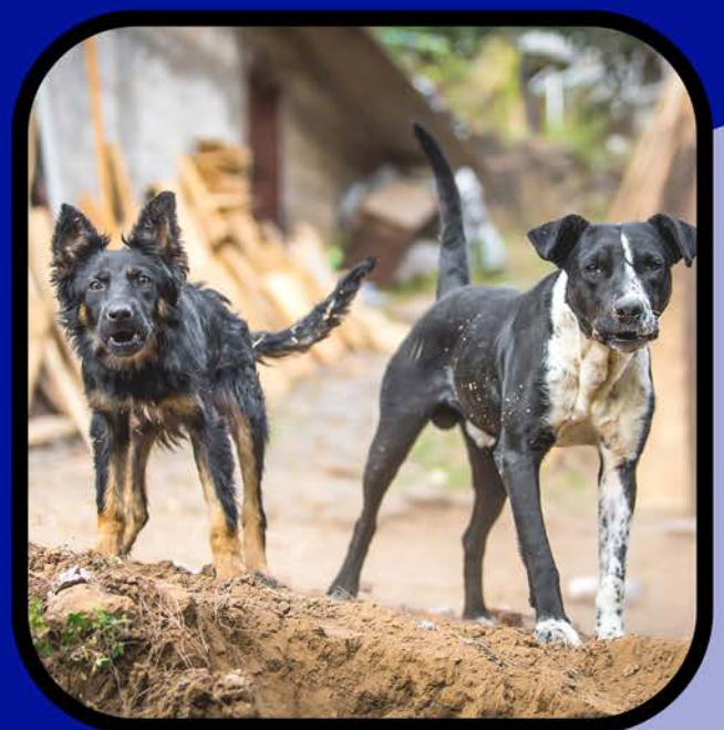
Vida silvestre y mascotas desatendidas