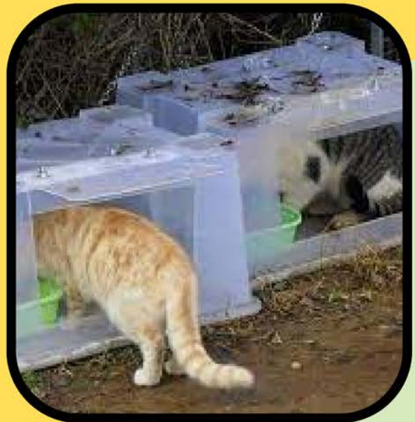
Alimentación y apoyo a la colonia de voluntarios