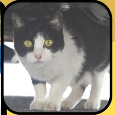
Se puede permitir que el gato mascota deambule afuera