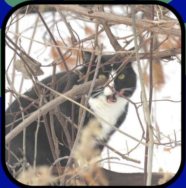
Falta de refugio