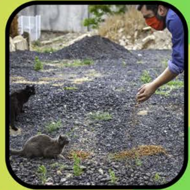
Alimentador de colonias