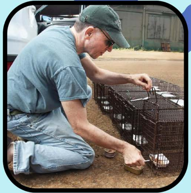
Colocar trampa humana con cebo