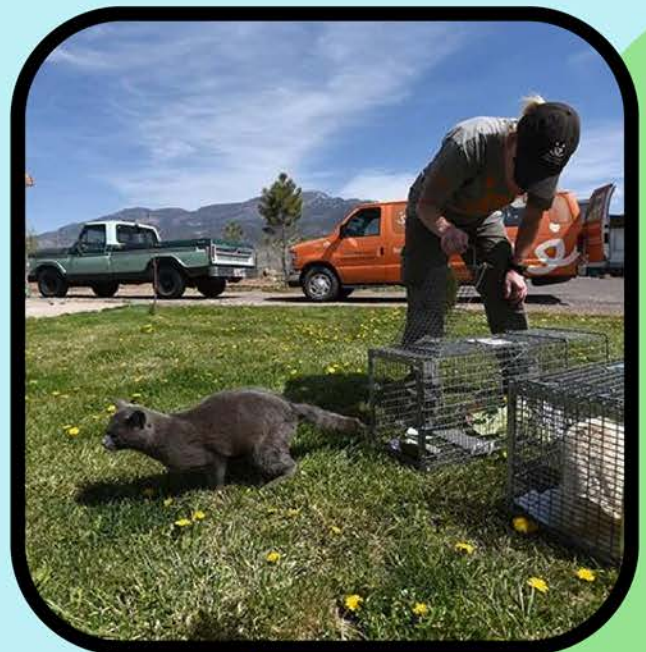
Después de la recuperación, regrese a su lugar seguro y habitual