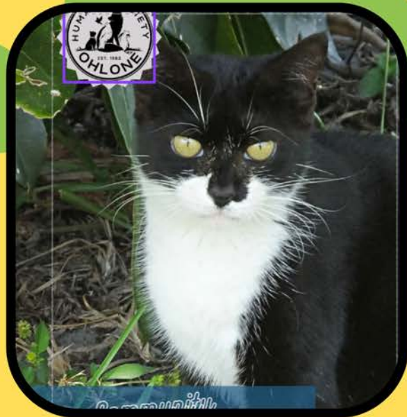
Educación sobre el control de la población de gatos en la comunidad