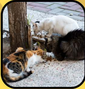
Gato salvaje o montés nacido y vivido siempre al aire libre