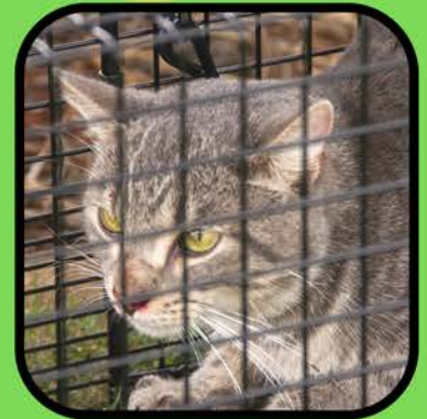
Ayuda antes y después de las operaciones.