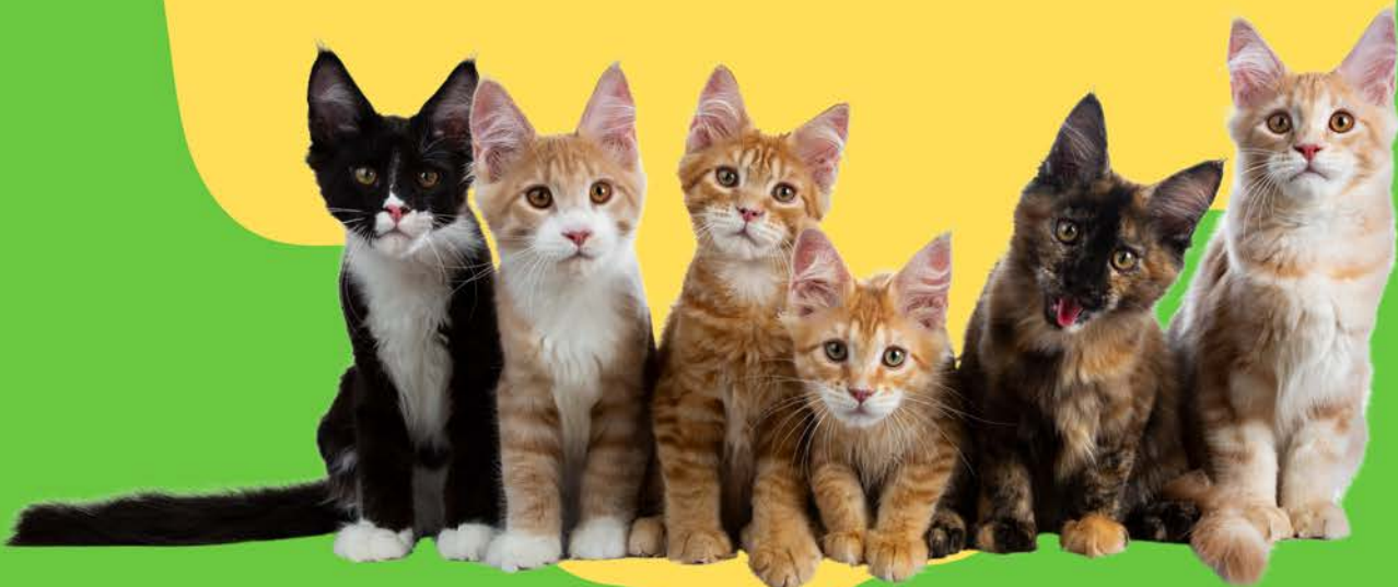
Gatitos nacidos de un gato comunitario