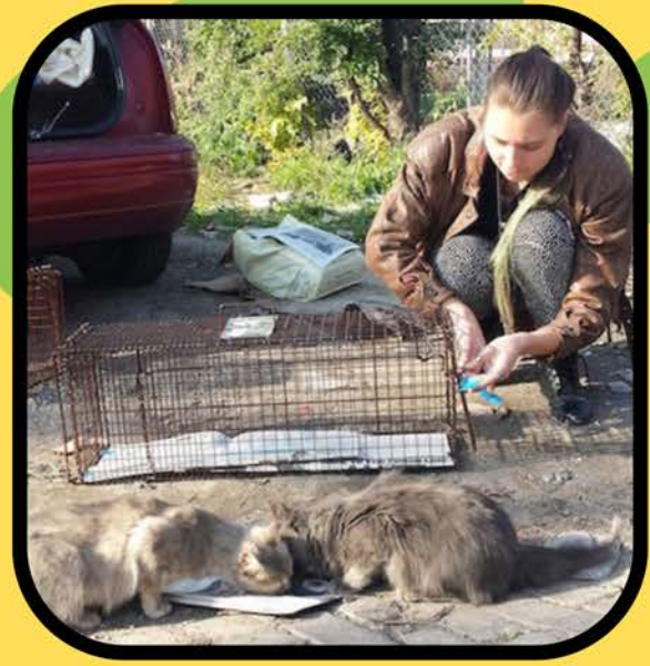
Grupos de captura