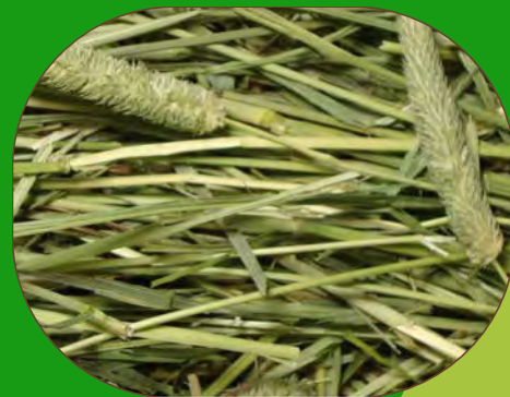
提摩西乾草，顆粒， 某些新鮮農產品