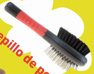
Cepillo de pelo