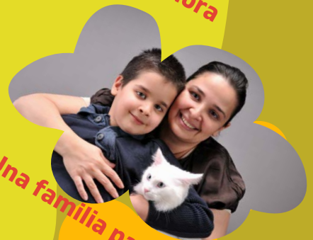
Una familia para amar