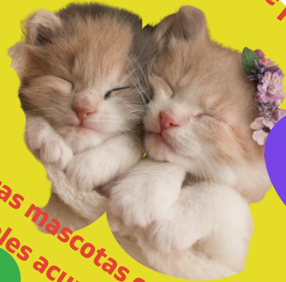
Otras mascotas con las cuales acurrucarse