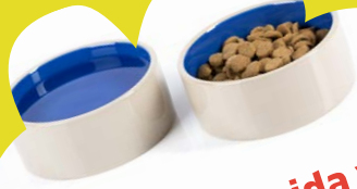
Platos de comida y agua