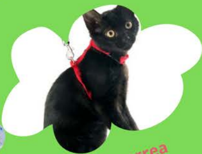
Collar y correa