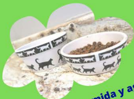
Platos de comida y agua