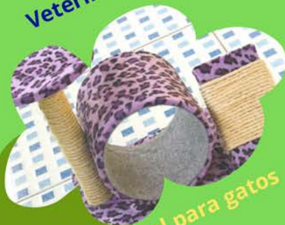
Árbol para gatos