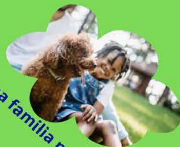
Una familia para amar