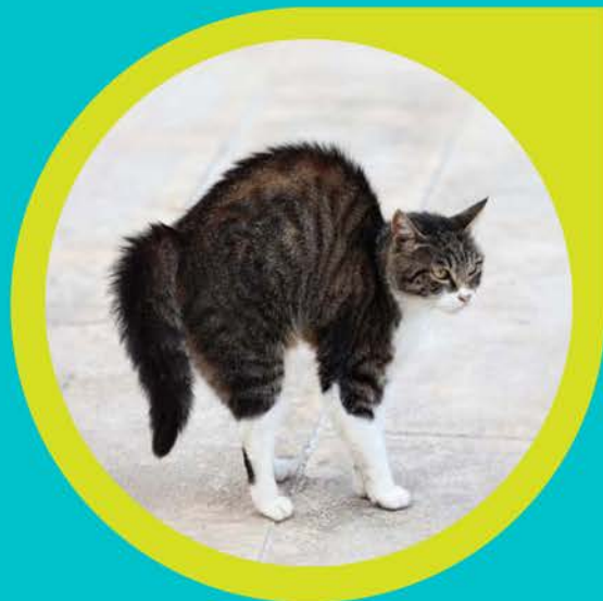
¡No te acerques!