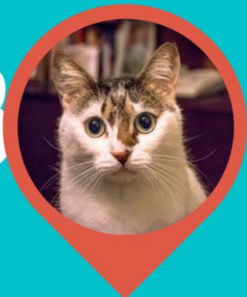
Preocupado o Inseguro