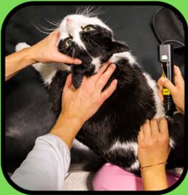
पशु चिकित्सा देखभाल