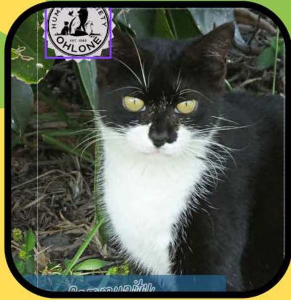
सामुदायिक बिल्ली जनसंख्या नियंत्रण के बारे में शिक्षा