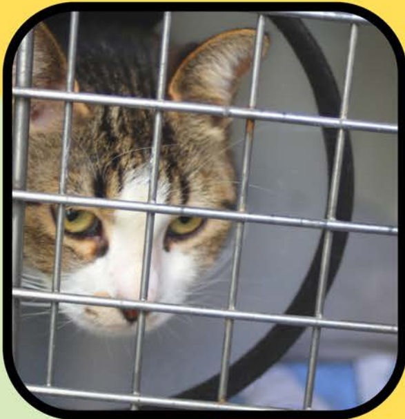
बधिया/नसबंदी सहायता क्लीनिक और कम लागत वाले वाउचर