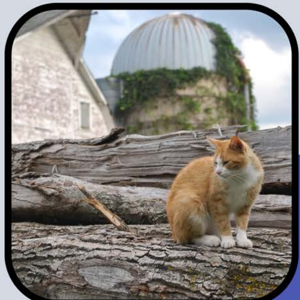
अपने घरों की रक्षा करना