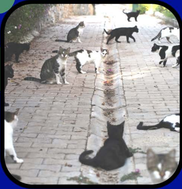
बहुत सारी बिल्लियाँ