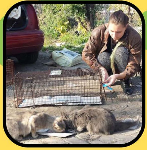
पकड़ने वाले समूह