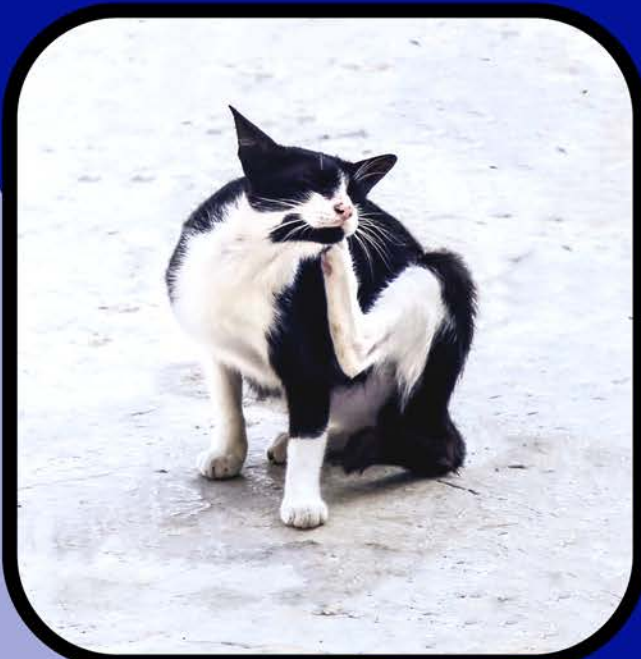
चिकित्सा देखभाल का अभाव