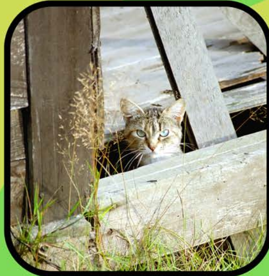
सुरक्षित छिपने के स्थान