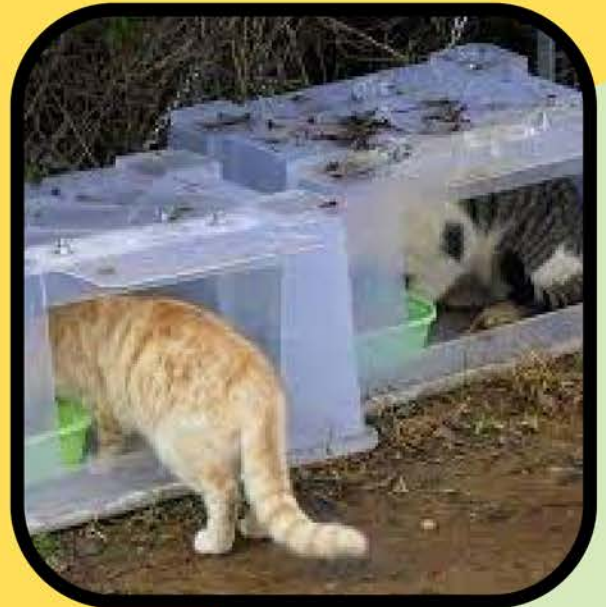
कॉलोनी में भोजन और सहायता के लिए स्वयंसेवक