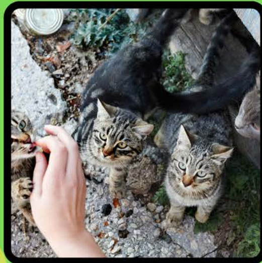
मिलनसार बिल्ली के बच्चों का बचाव