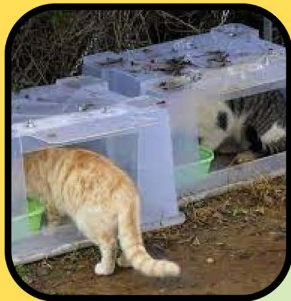
志愿者对群居猫的喂养和支持