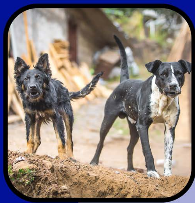
野外生活和无人看管的 宠物