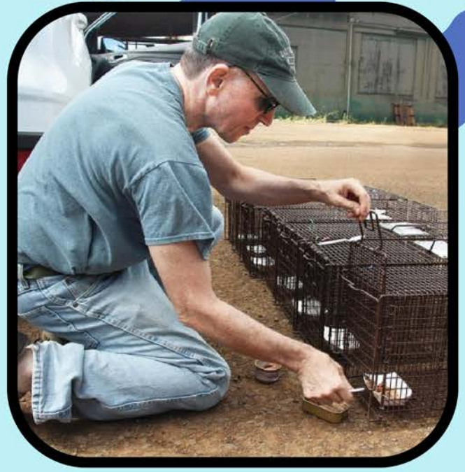
放置带诱饵的人道捕猫器