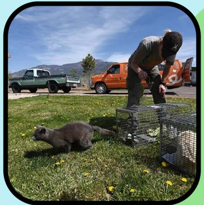
在它康复后将其送回原来的安全地点