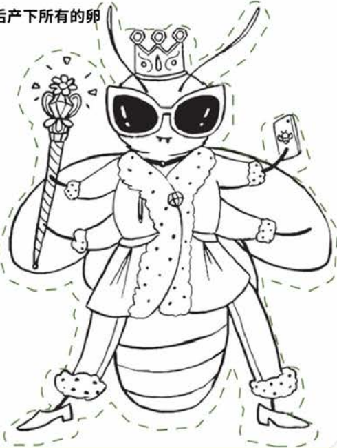
蜂后产下所有的卵