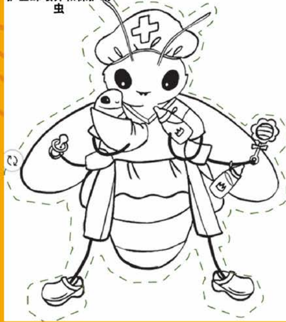
护士蜂喂养和保护幼虫