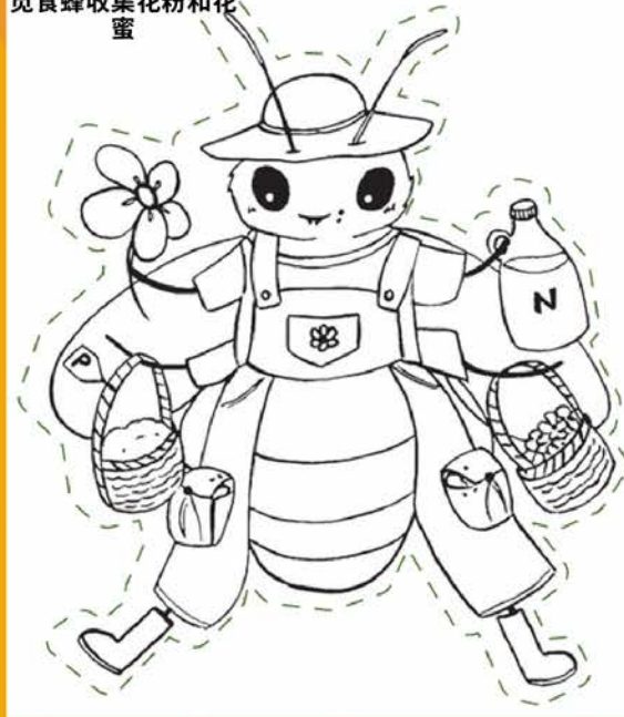
觅食蜂收集花粉和花蜜