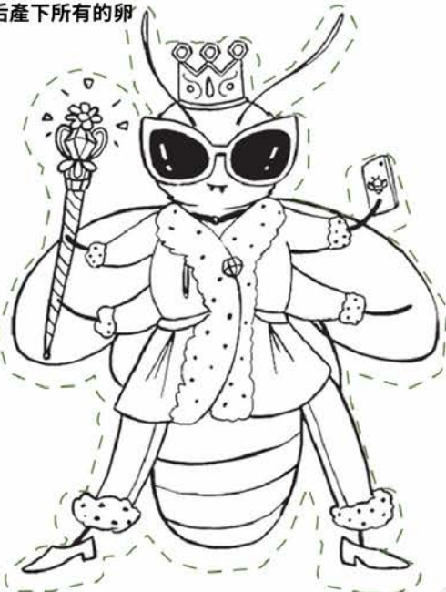
蜂后產下所有的卵