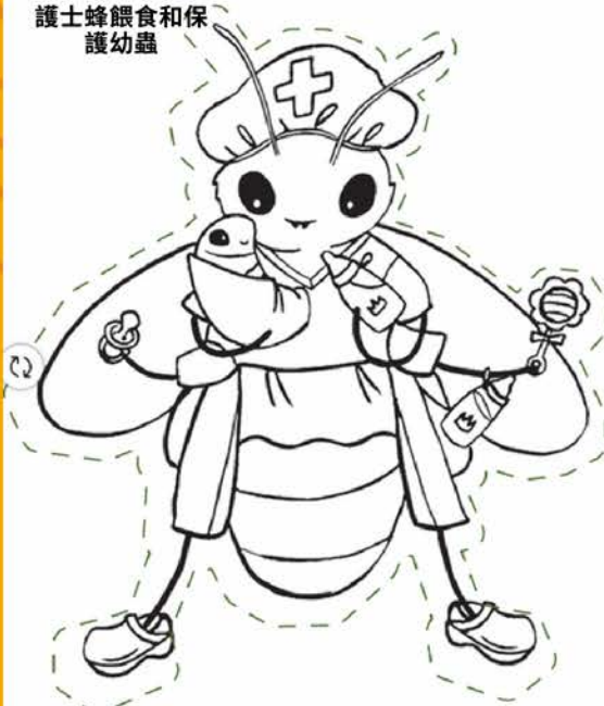
護士蜂餵食和保護幼蟲